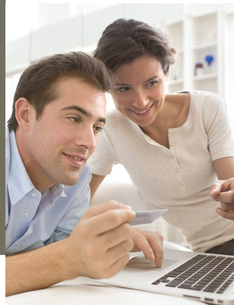
VU, Jan Depiest, WTC III, Simon Bolivarlaan 30/9, 1000 Brussel

De elektronische identiteitskaart met tal van mogelijkheden